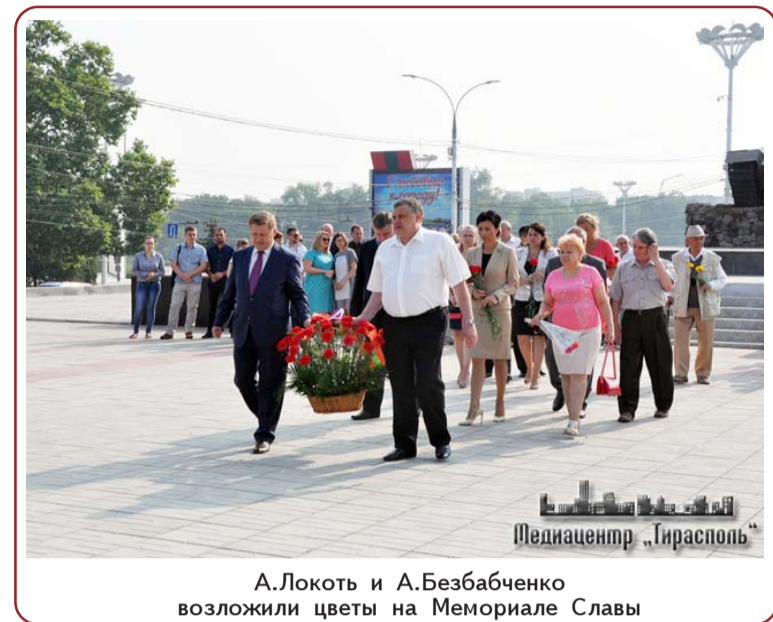
А.Локоть и А.Безбабченко возложили цветы на Мемориале Славы

приехал в замечательный курортный город, очень красивый, своеобразный, привлекательный, а главное - чистый, город убирается, мусор на дорогах не лежит. Проведена колоссальная работа по благоустройству, очень много зеленых зон, чем Новосибирск в силу своего бурного развития, к сожалению,