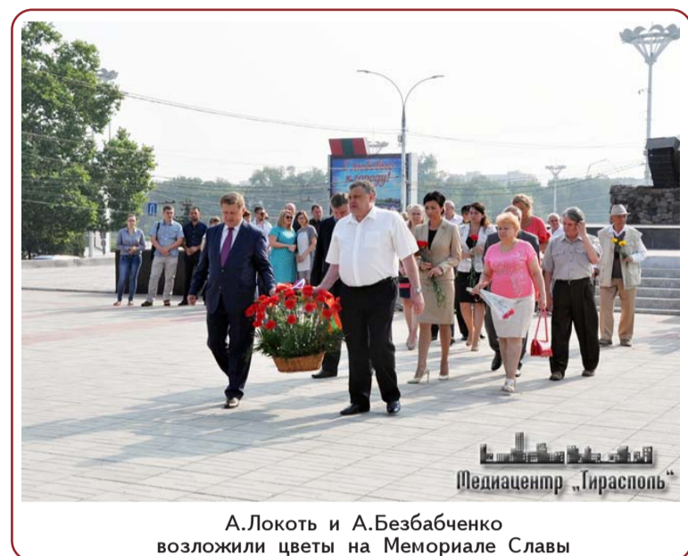
А.Локоть и А.Безбабченко возложили цветы на Мемориале Славы

приехал в замечательный курортный город, очень красивый, своеобразный, привлекательный, а главное - чистый, город убирается, мусор на дорогах не лежит. Проведена колоссальная работа по благоустройству, очень много зеленых зон, чем Новосибирск в силу своего бурного развития, к сожалению,